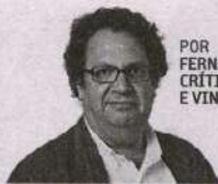
POR FERNANDO MELO CRÍTICO COMIDA E VINHOS

brilhou pelo sentido da perfeição. O jantar abre em beleza com um tártaro de wagyu com caviar oscietra servido em forma de tarteleto. Equilibrado e estimulante, como manda a regra no capítulo entradeiro. Seguiu-se a interpretação de sapateira, assessoria perfeita de abacate, ovas de truta e maçã verde. Sabores muito presentes e assumidos, jogo de texturas cativante. Chega o momento de servir o pão para a refeição, e que pão! Trigo barbela, frescura e sabor irreprensíveis, três manteigas apresentadas. Entramos no corpo do jantar, portanto. Servem então o chawanmushi de cebola, integração de avelã, noz fermentada, amêndoa e óleo de abóbora, interessante na preparação para mudança de registo. Vem o que foi um dos três melhores pratos do jantar, composto por foie gras, enguia fumada, beterraba e vinagre balsâmico de Modena, maridagem feliz com vinho Madeira Medium